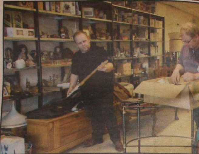
Linksonder en dan met de klok mee: Boekhandel De Laerpoort, Jones