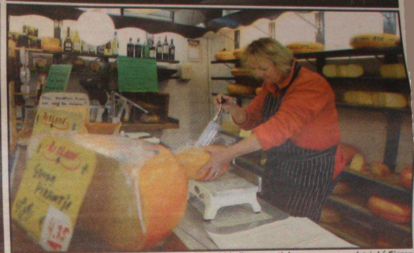
Lederwaren, het Goudse Kaasboertje en de winkel in tweedehandskleding en antiek.